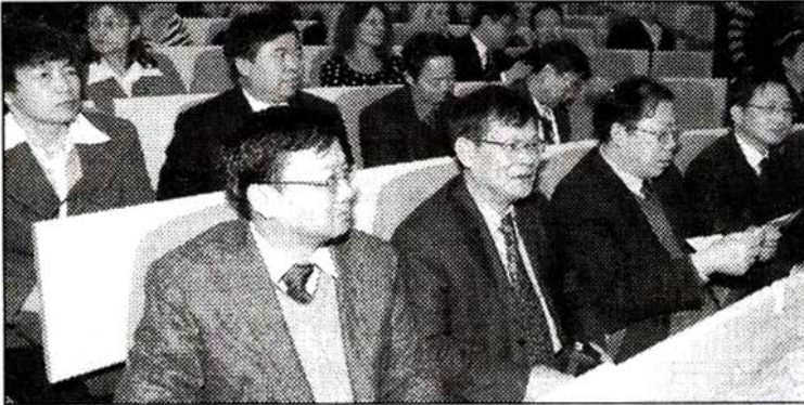
ГОСТИ Представници кинеских универзитета