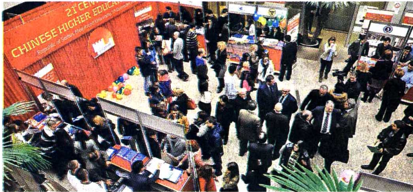
На Мегатренд универзитету

На првом кинеском сајму образовања у нашој земљи представило се 14 универзитета, колеџа и института из најмногољудније земље света